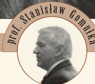
Prof. Stanisław Gombka

Decydująca rola państwowego współwłaściciela może wynikać także z zapisów w statutach spółek, które dają mu uprzywilejowaną pozycję (np. Orlen). W efekcie, posiadając mniejszościowe udziały, może on decydować o wszystkim, także o inwestycjach.