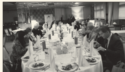
Spotkanie „przy kominku”

Łoża Świętokrzyska zorganizowała dla swoich członków spotkanie towarzyskie „przy kominku” połączone z możliwością prezentacji nowych produktów firm członkowskich.