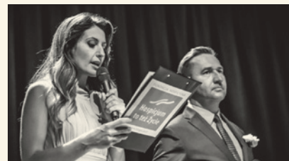
Koncert charytatywny inaugurujący kampanię społeczną

Hospicjów i Opieki Paliatywnej. Wydarzenie jak co roku zorganizowała Fundacja Hospicyjna w ramach cyklu Głosy dla Hospicjów.