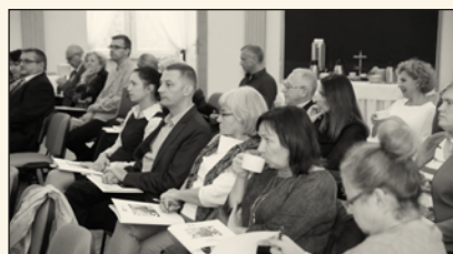
Spotkanie Akademii Kompetencji

W ramach Akademii Rozwoju Kompetencji odbyło się spotkanie, podczas którego poruszone zostały następujące tematy: zmiany w CIT, ceny transferowe, prawno-karne ryzyko pracodawcy.