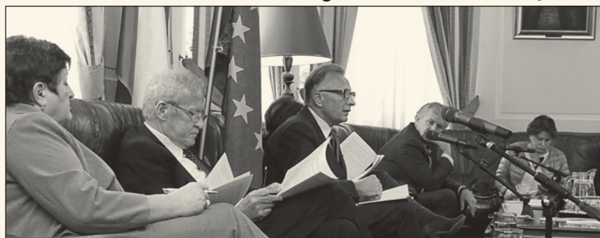
Ministrowie mówili m.in. o zmianach podatkowych