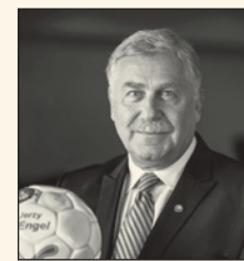
Władysław Jerzy Engel

Absolwent Akademii Wychowania Fizycznego w Warszawie, trener klasy mistrzowskiej oraz najwyższej klasy międzynarodowej UEFA-PRO. Selekcjoner Reprezentacji Polski w Piłce Nożnej w latach 2000-2002 (awans z reprezentacją do Mistrzostw Świata w Korei i Japonii). Dyrektor Sportowy w PZPN w latach 2006-2012. W 2001 roku został sklasyfi-