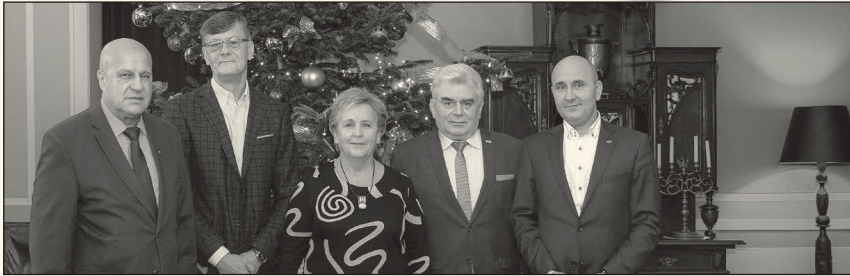
Członkowie Komisji Spółdzielczości