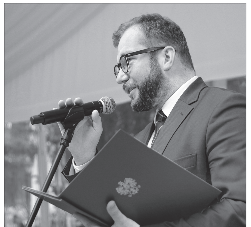
Minister Grzegorz Puda z Ministerstwa Inwestycji i Rozwoju odczytał list od Premiera RP i wręczył prezydenckie odznaczenia.

– Śląska Gala Business Centre Club jest od lat jednym z najważniejszych i najbardziej oczekiwanych wydarzeń. Wszystkich Państwa zapewniam o mojej pamięci – napisał w liście do uczestników uroczystości premier Mateusz Morawiecki . – Idee i postawy, tutaj dziś tak licznie reprezentowane i nagradzane, są osią polityki polskiego rządu. Dzisiaj nagradzacie Państwo liderów, wybitnych