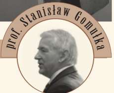
prof. STANISŁAW GOMUŁKA

Rząd zakłada utrzymanie tempa wzrostu PKB w latach 2018-2020 na stabilnym poziomie bliskim 4%, to znaczy powyżej tempa długofalowego, natomiast uczestnicy Ankiety Makroekonomicznej NBP prognozują kontynuację odbicia i w rezultacie lepszy niż MF wynik w roku bieżącym, ale wyraźne spowolnienie tempa wzrostu gospodarczego Polski w latach 2019-2020. Długofalowe prognozy instytucji międzynarodowych – MFW i EBRD, a także polskich ekonomistów, wskazują na duże prawdopodobieństwo dalszego silnego spowolnienia wzrostu w następnych 20-30 latach, do poziomu około 1,5%.