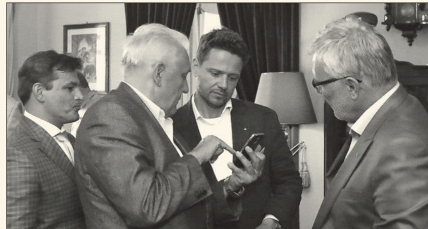
Dyskusja z warszawskimi przedsiębiorcami