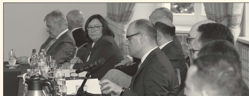
Kancelerze omówili najważniejsze problemy gospodarce

Odbyło się pierwsze po wakacjach spotkanie Zarządu BCC – Łoży Kancelerskiej.