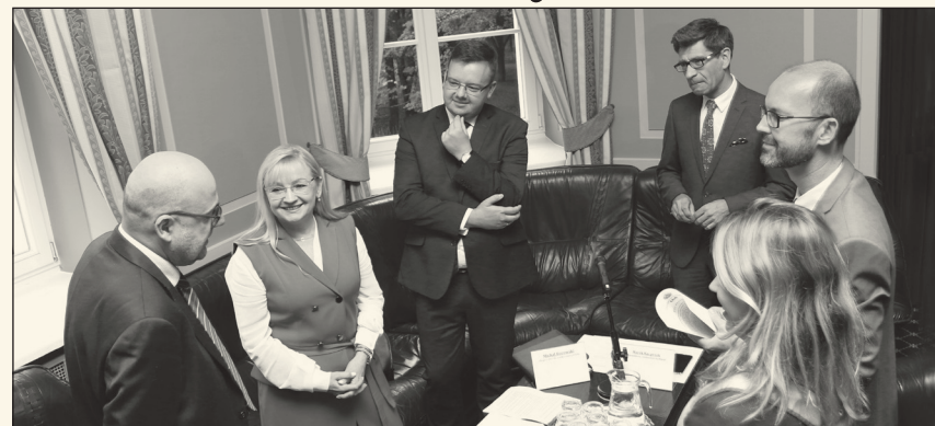
Uczestnicy debaty eksperckiej w BCC