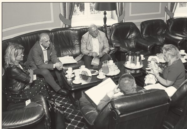
Spotkanie Komisji ds. usług zdrowotnych