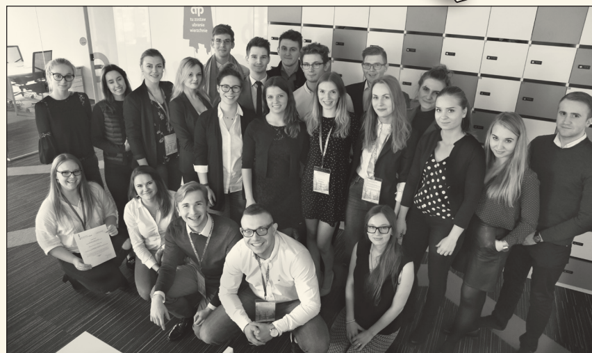
Konwent Inauguracyjny Fundacji SF BCC