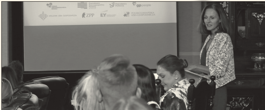
Podczas konferencji żywo dyskutowano o sytuacji cudzoziemców w Polsce.